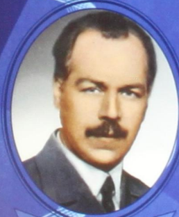
Н. И. Вавилов