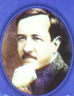
А. В. Чаянов