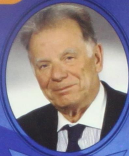
Ж. И. Алферов