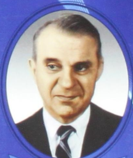
В. В. Леонтьев