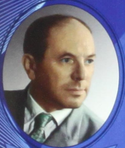
Л. В. Канторович