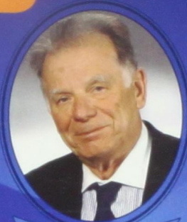
Ж. И. Алферов