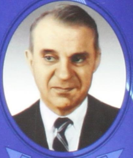
В. В. Леонтьев