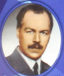
Н. И. Вавилов