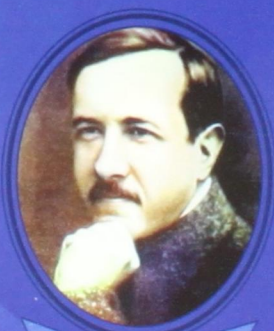
А. В. Чаянов