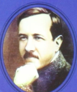
А. В. Чаянов