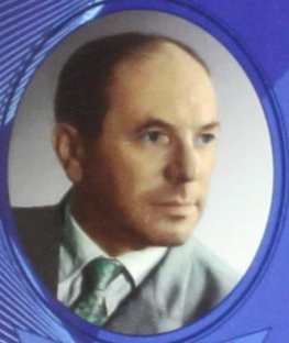
Л. В. Канторович