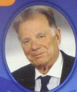
Ж. И. Алферов