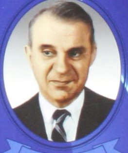
В. В. Леонтьев