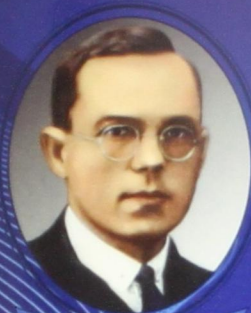
Н. Д. Кондратьев