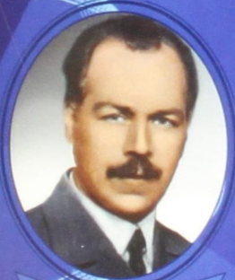
Н. И. Вавилов