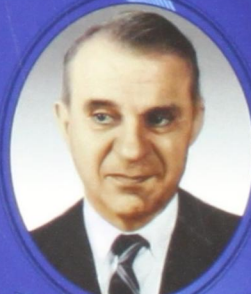
В. В. Леонтьев