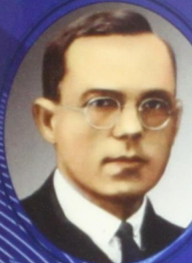
Н. Д. Кондратьев