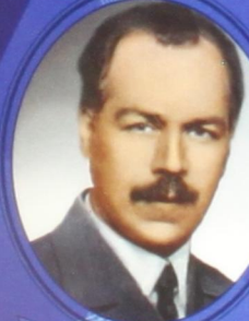
Н. И. Вавилов