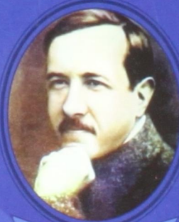
А. В. Чаянов