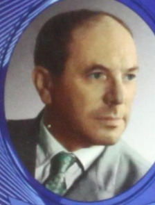
Л. В. Канторович