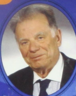
Ж. И. Алферов