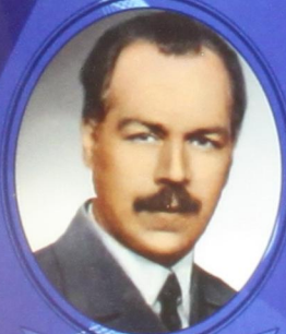
Н. И. Вавилов