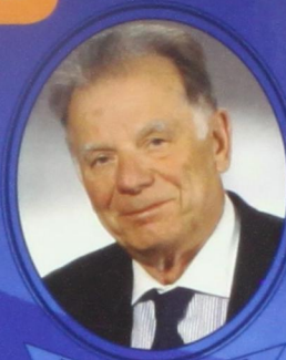
Ж. И. Алфёров