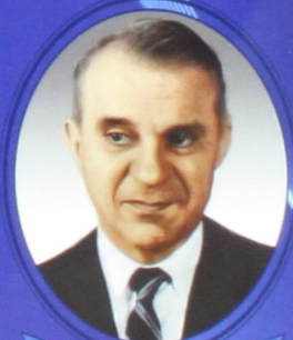
В. В. Леонтьев