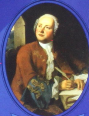
М. В. Ломоносов