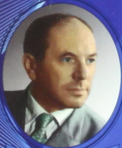
Л. В. Канторович