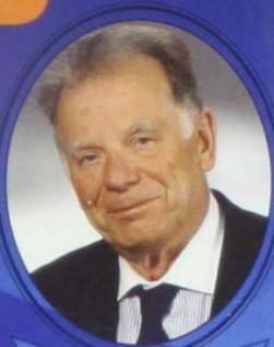
Ж. И. Алферов