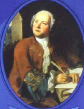
М. В. Ломоносов