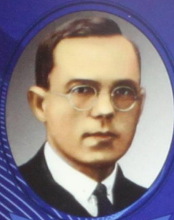
Н. Д. Кондратьев