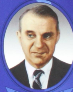
В. В. Леонтьев