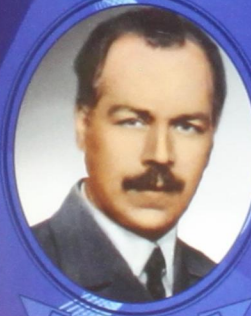
Н. И. Вавилов