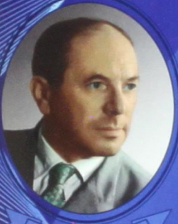
Л. В. Канторович