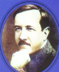
А. В. Чаянов