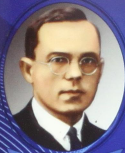
Н. Д. Кондратьев