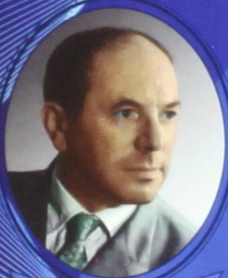
Л. В. Канторович