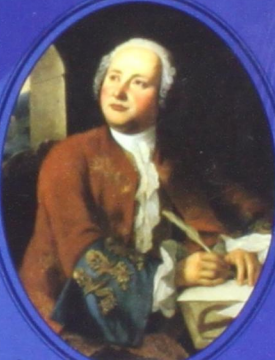
М. В. Ломоносов