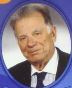
Ж. И. Алферов