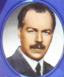
Н. И. Вавилов