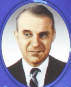
В. В. Леонтьев