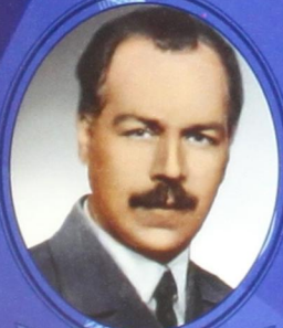
Н. И. Вавилов