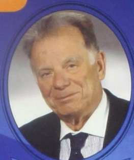
Ж. И. Алфёров