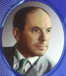
Л. В. Канторович