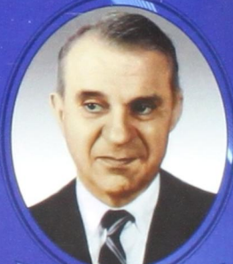
В. В. Леонтьев