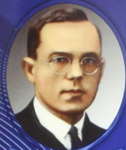
Н. Д. Кондратьев