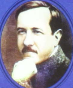
А. В. Чаянов