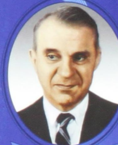
В. В. Леонтьев