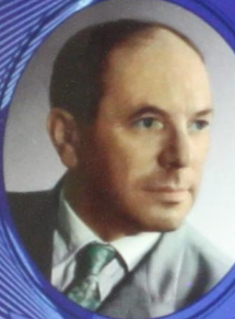
Л. В. Канторович