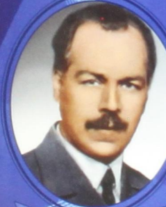
Н. И. Вавилов