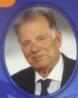
Ж. И. Алферов