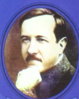
А. В. Чаянов