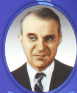
В. В. Леонтьев