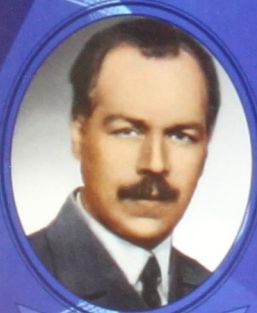
Н. И. Вавилов