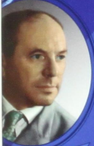
Л. В. Канторович