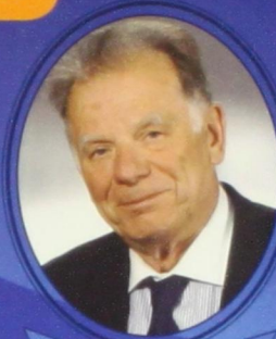
Ж. И. Алферов