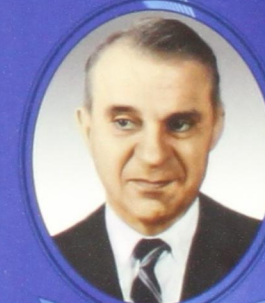
В. В. Леонтьев