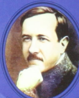
А. В. Чаянов