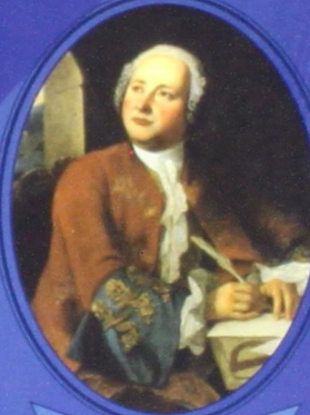
М. В. Ломоносов