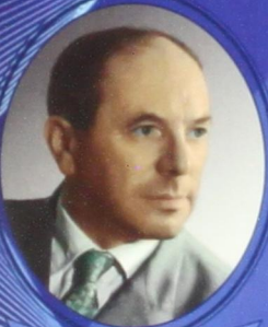
Л. В. Канторович