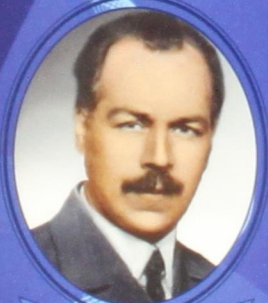
Н. И. Вавилов