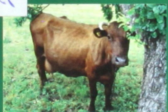
Красная горбатовская порода